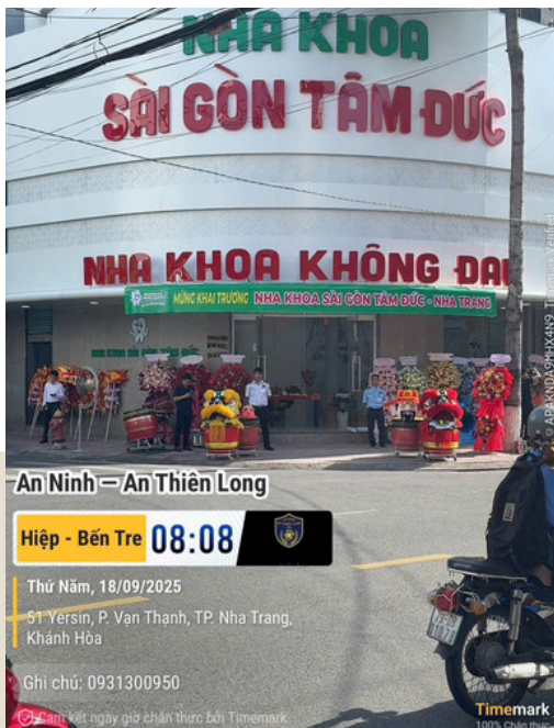
Nha Khoa Sài Gòn Tâm Đức