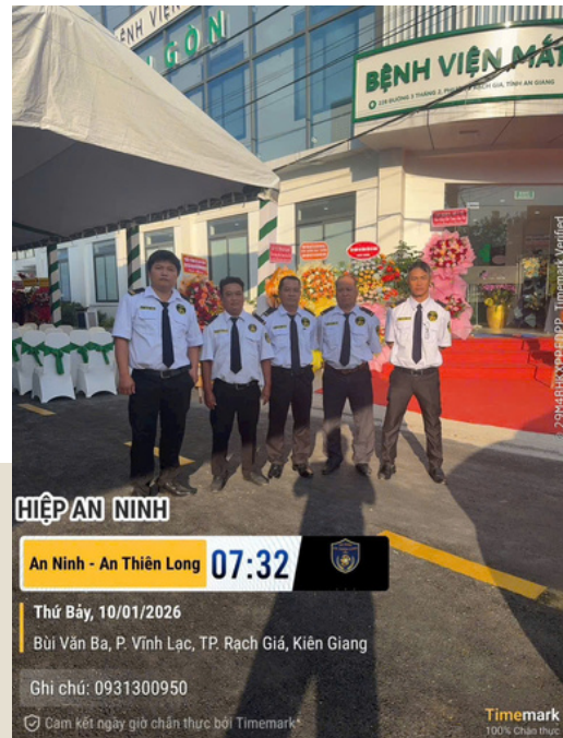
Bệnh Viện Mắt An Giang