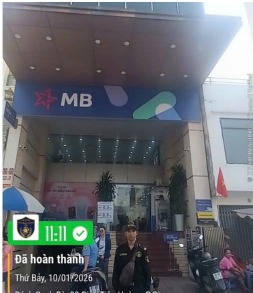
Ngân hàng Quân Đội MB Bank

Danh sách khách hàng nội bật của An Ninh Thiên Gia